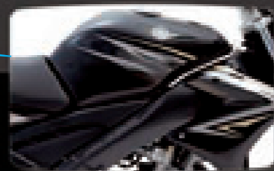
Hitam / 黑

Jenis Kerangka • 车构架 : Berlian • 钻石型 Panjang menyeluruh • 全长 : 2000mm Lebar menyeluruh • 全宽 : 705mm Tinggi menyeluruh • 全高 : 1035mm Tinggi pelana • 座位高度 : 760mm Jarak roda • 轴距 : 1282mm Kelegaan tanah minimum • 离地距离 : 167mm Berat kering • 净重 : 114 kg