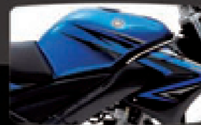
Biru / 蓝