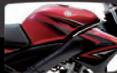
Merah / 红