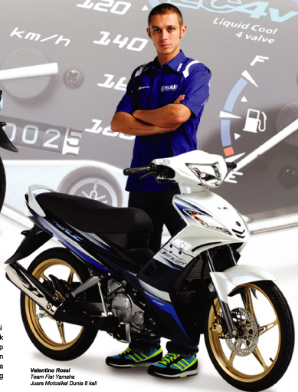
Valentino Rossi Team Fiat Yamaha Juara Motosikal Dunia 8 kali