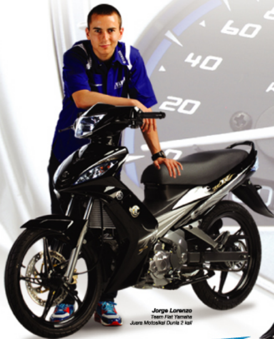
Jorge Lorenzo Team Fiat Yamaha Juara Motosikal Dunia 2 kali